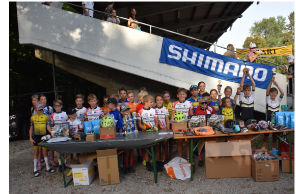
Die Schülerrennen waren 2025 besucht wie fast noch nie. Eine grossartige Ausgangslage für die Radsportzukunft der Region.