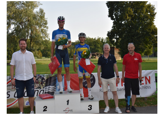
Siegerehrung Gesamtklassement Kat. B